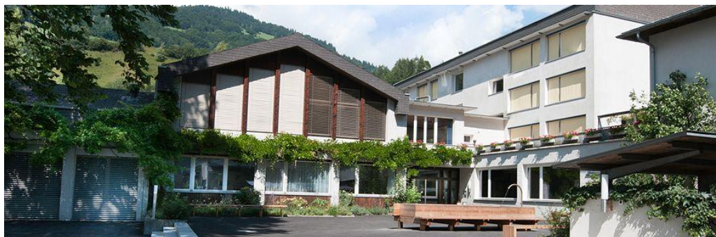
Bildungszentrum Palottis, Schiers