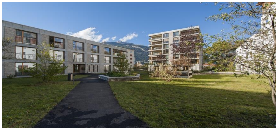
Seniorenzentrum Rigahaus, Chur

Jeweils eine Gruppe Fachfrauen Hauswirtschaft und eine Gruppe Hauswirtschaftspraktikerinnen gingen mit den entsprechenden Kleidern zum Service oder in die Reinigung. Dort konnten alle in Kleingruppen gemeinsam eine Prüfungsaufgabe praktisch durchspielen. In der Reinigung wurden die Reinigungshilfsmittel und die Arbeit mit den Reinigungsmaschinen vertieft. Gemeinsam wurden die Übungen besprochen und offene Fragen zu den Prüfungen konnten geklärt werden. Nach 1 ½ Stunden gab es eine kurze Pause und dann wechselten die Gruppen zum nächsten Prüfungsgebiet.