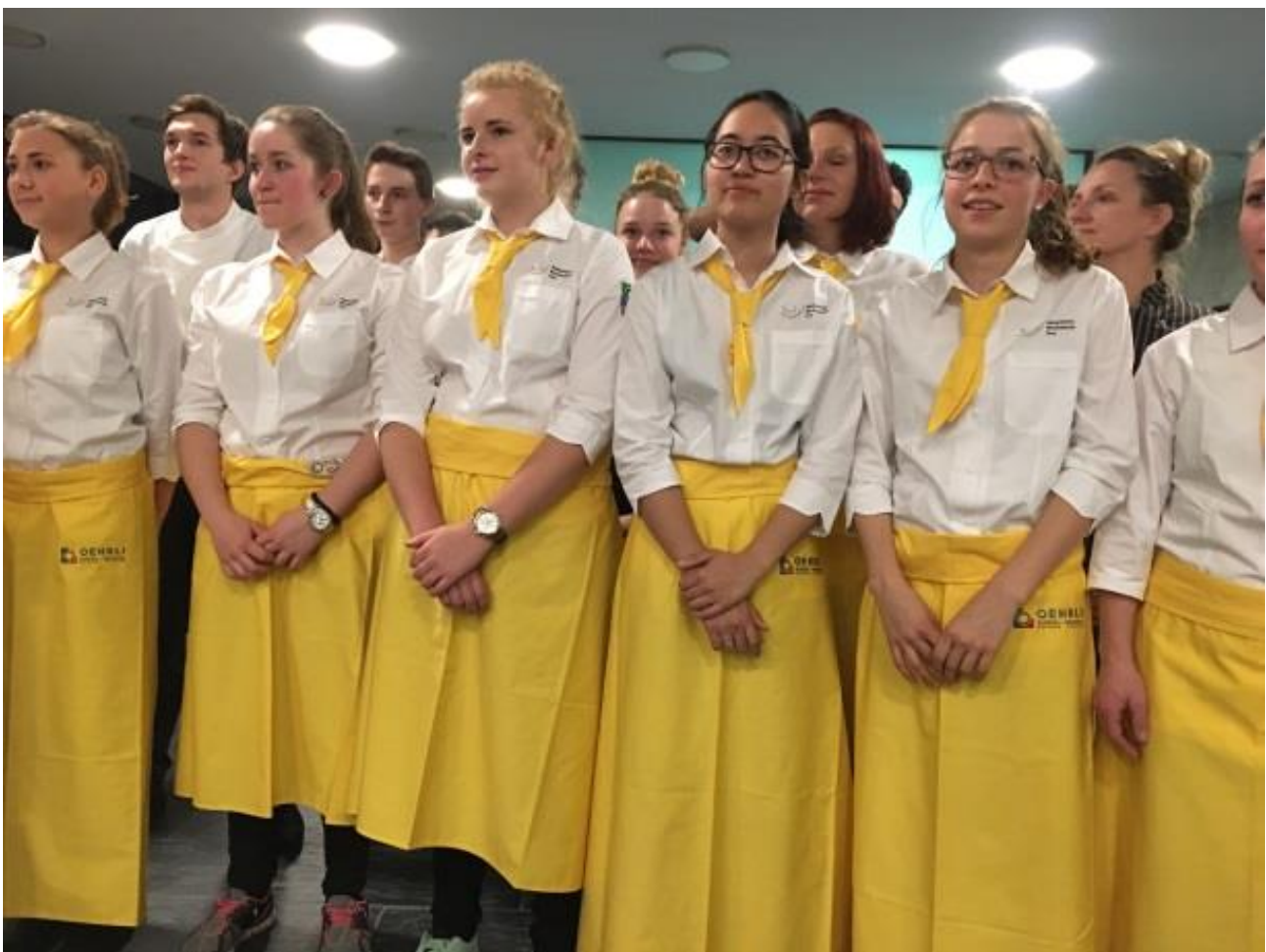
Das Servicepersonal der Abschlussklasse Fachfrau Hauswirtschaft

Unsere Lernenden hatten mit dieser Veranstaltung eine hervorragende Gelegenheit ihre Fachkompetenz im Bereich Service unter anderen Bedingungen als gewohnt zu vertiefen.