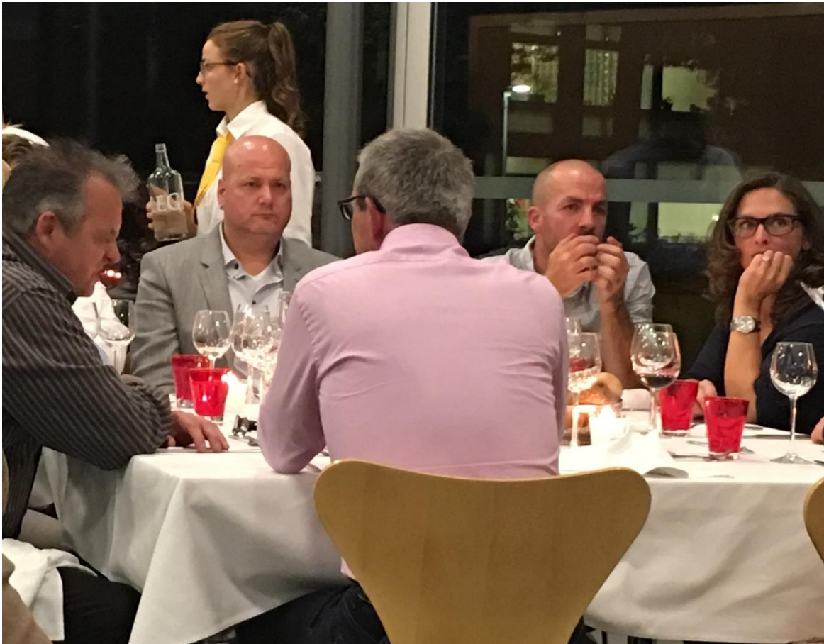
Gäste des speziellen Anlasses der Abschlussklasse Fachfrau Hauswirtschaft